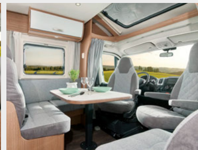
Wohnwelt Nebula bei Clever und Clever+ Modellen (nicht bei Standard-Modellen)