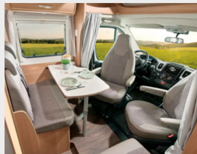
Wohnwelt Terra bei Standard-Modellen (nicht Clever und Clever+)