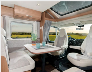
Wohnwelt Arctica bei Standard-Modellen (nicht Clever und Clever+)