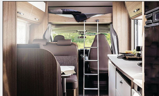
A 464 mit Doppel-Dinette und z.B. Polster Terra