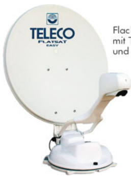
Flach-Bildschirm mit TFT-Halterung und Sat-Anlage Teleco Flat Light 65