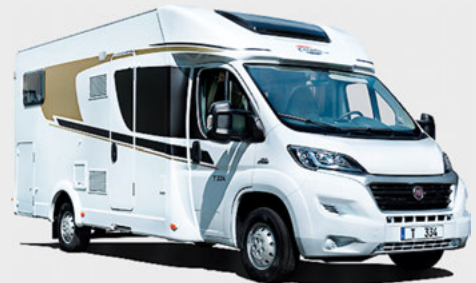
Standardoptik Carado T-Serie und Clever Editionen (nicht Clever+)