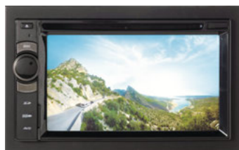
2-DIN Radio Moniceiver