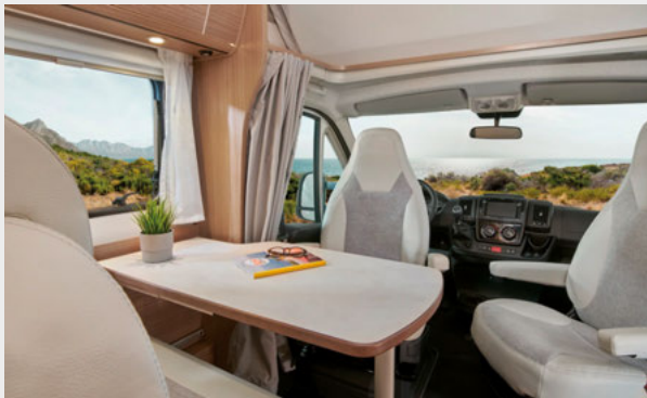
A 132 mit Halb-Dinette und z.B. Polster Arctica