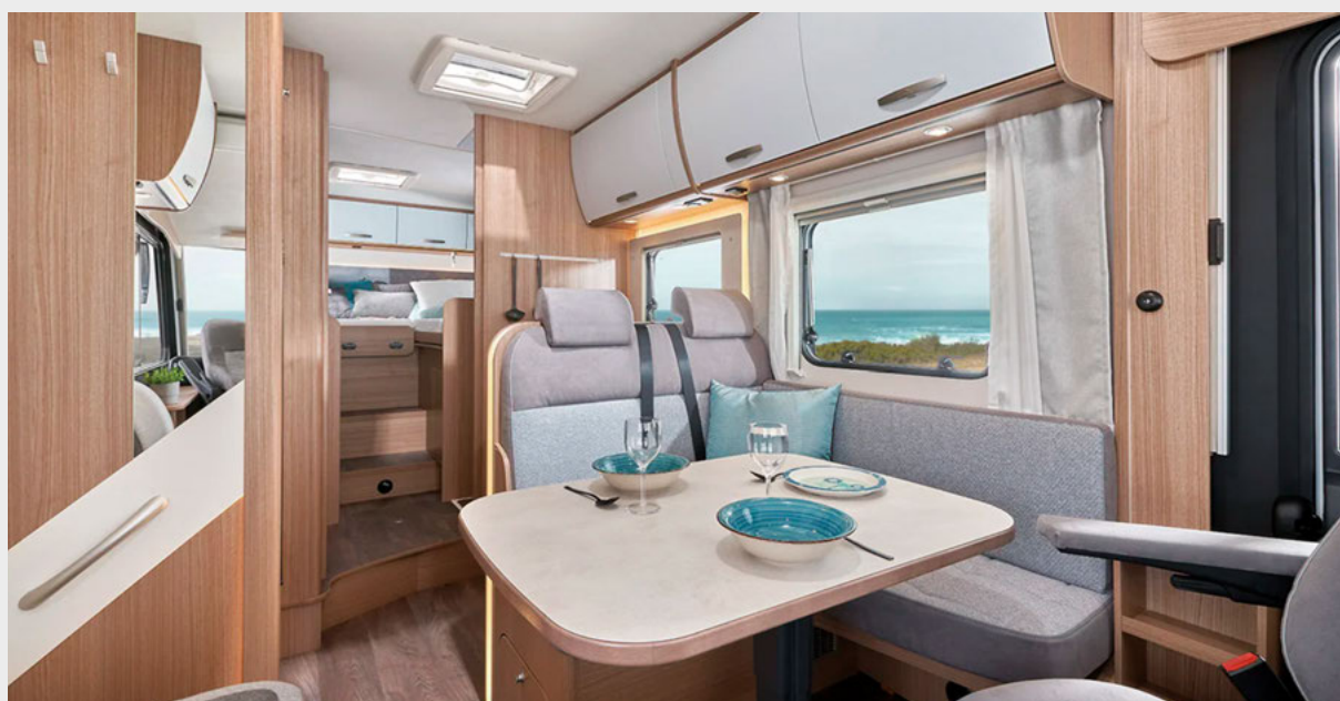
Modell i 447 Clever+ Edition mit Wohnwelt „Nebula“