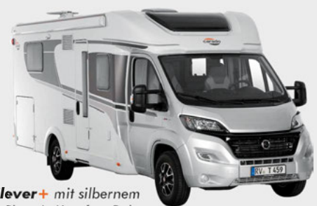
Sonderedition Clever+ mit silbernem Fahrerhaus und Chassis-Komfort-Paket